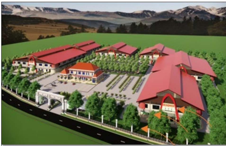
Gambar 2. Perspektif Bangunan Sport Center