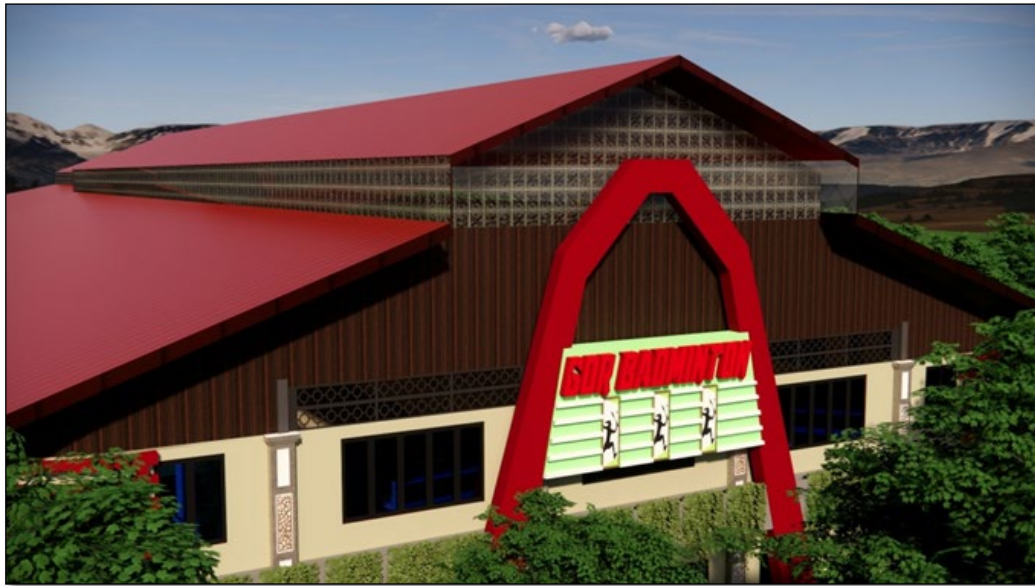
Gambar 7. Pencahayaan Alami