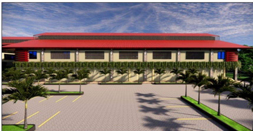
Gambar 5. Tampak Samping Bangunan Dengan Media Tanaman

Pada bangunan Sport Center terdapat pepohonan yang membuat bangunan terasa sejuk dan area naungan pohon terlindungi dari sinar matahari sehingga memungkinkan pengguna merasakan aroma angin dan cahaya. Adanya Vegetasi dan tanaman di sekitar bangunan yang memberikan rangsangan positif pada pengguna dan terdapat bukaan di parkir bangunan sehingga pengguna tidak hanya merasakan aroma angin dan cahaya dari luar bangunan, namun juga merasakan di dalam bangunan parkir dan bangunan utama Sport Center.