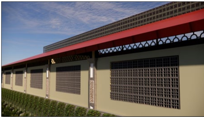
Gambar 6. Penghawaan Alami

Aliran udara di peroleh pada bukaan bangunan yang menghadap utara. Bukaan pada bangunan mencapai dari dinding sehingga dapat memaksimalkan udara masuk kedalam bangunan.