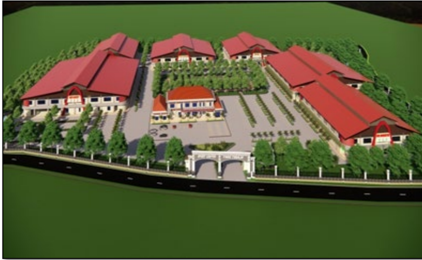
Gambar 3. Tampak depan bangunan

dalam bangunan pengguna bisa merasakan kenyamanan pada saat beda di dalam bangunan melalui panca Indra.